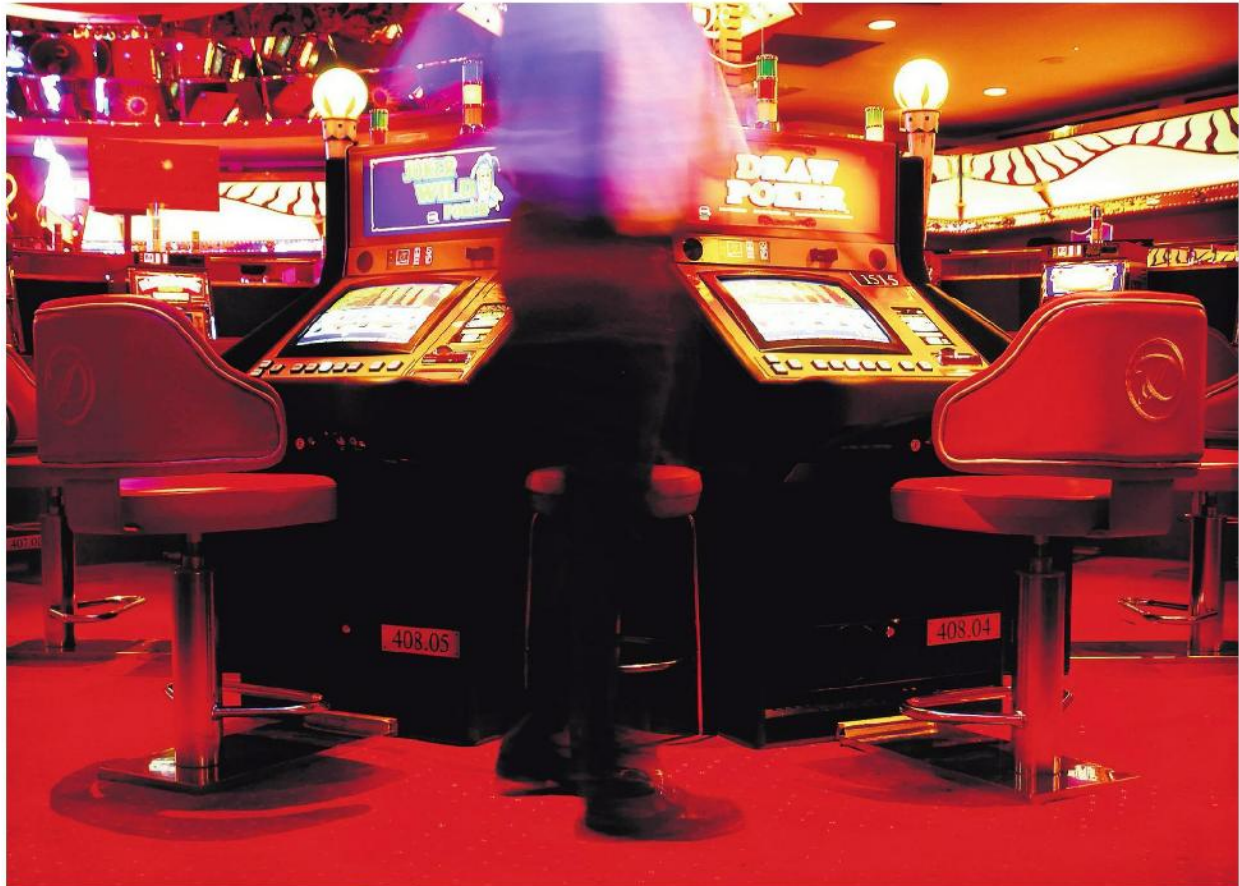
Die Spielsucht bedeutet oft viel Leid und kann ganze Familien in den Ruin treiben.

Ostschweizer Kantone eröffnen Anlaufstelle samt Gratisnummer und Homepage